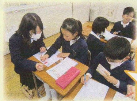
中2から小4へのピアサポート

中学生のピアサポートとして、昭和小では、4年の算数『小数』の授業に参加し、熱心に計算の仕方を教えました。