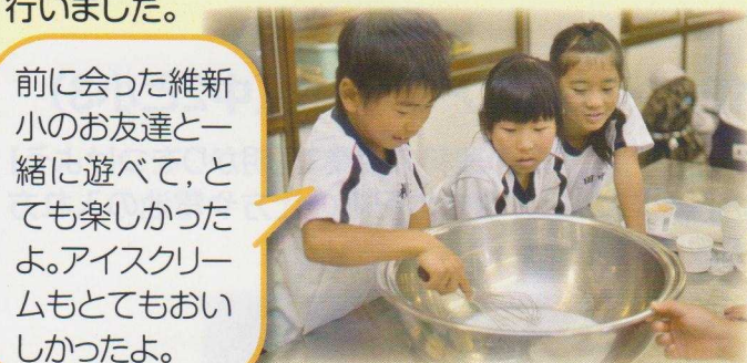
合同遠足のアイスクリーム作り

両校1～5年生がノースヴィレッジに一緒に出かけ、英語に親しむゲームやアイスクリーム作り体験などを行いました。