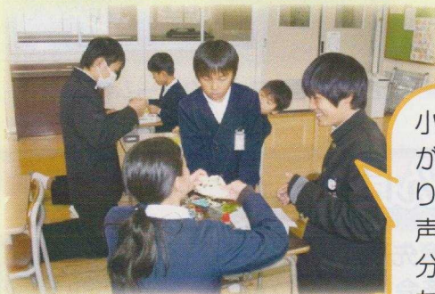
中2から小3へのピアサポート

維新小では、3年の理科の授業で『明かりをつけよう』の授業に参加し、導線の配線の仕方や電池の入れ方を教えました。