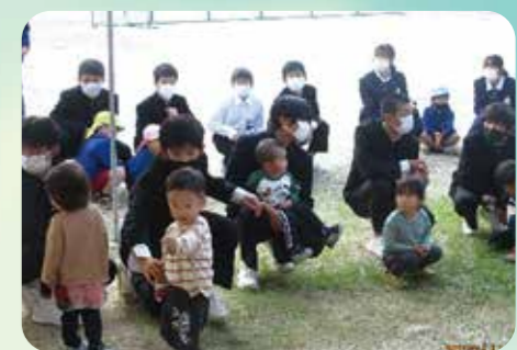
昭和中と学童保育のおひさまとの合同防災訓練を行いました。