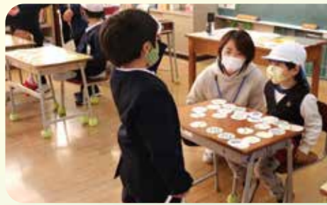
低学年が幼稚園児と交流授業を行いました。