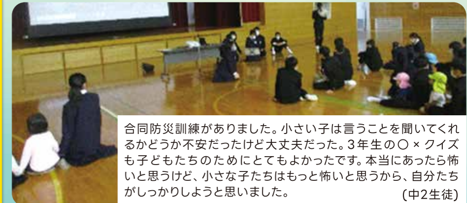
合同防災訓練がありました。小さい子は言うことを聞いてくれるかどうか不安だったけど大丈夫だった。3年生の〇×クイズも子どもたちのためにとてもよかったです。本当にあったら怖いと思うけど、小さな子たちはもっと怖いと思うから、自分たちがしっかりしようと思いました。(中2生徒)