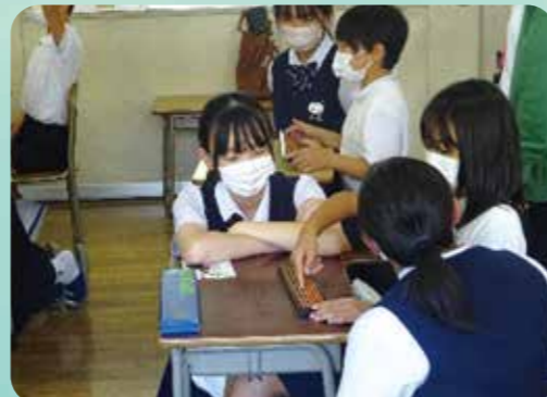
中学生が小学生にそろばんを優しく指導しました。