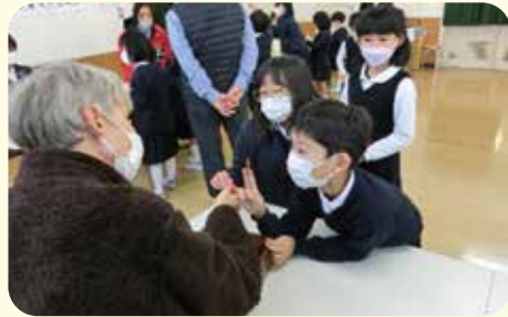
維新小学校と昭和小学校1・2年生が英語の合同授業を行いました。