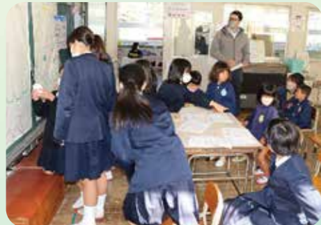
小学生がたくさんお店を準備し、昭和中幼稚園の園児を招いて、まつりを行いました。