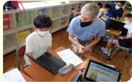
中学校のALTの先生に英語で自己紹介をしました。(小学校)