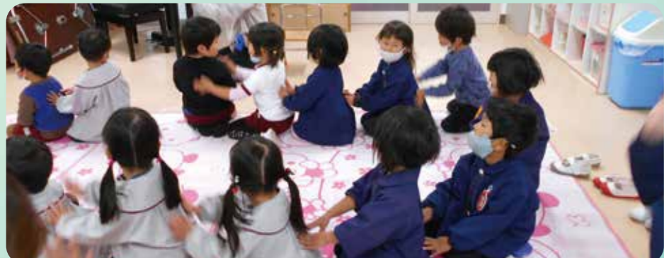
感染症対策を行いながら、各校園が仲良くなることができるように取り組んできました。