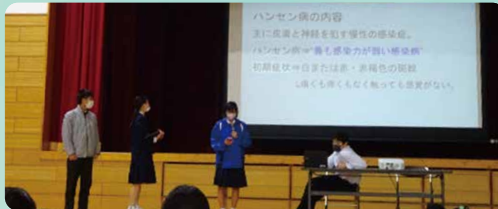
差別の現状や様々な人権の課題について各学年や委員会などで工夫を凝らした発表ができてみんなで真剣に考えることができました。