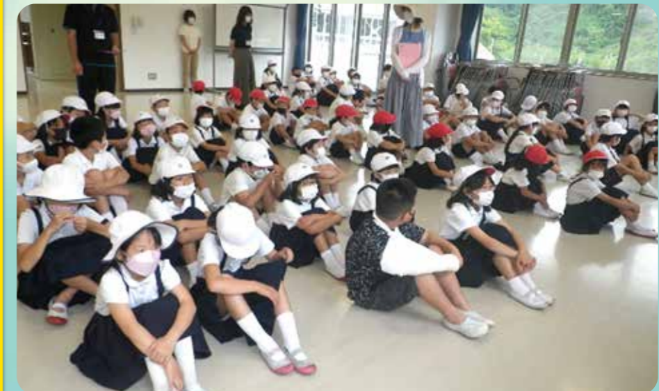
水害の歴史を知り、各地の様々なところで、繰り返し被害があることが分かりました。(小4児童)