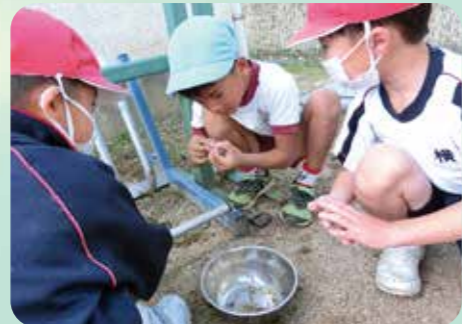
昭和小学校1年生の児童たちが幼稚園の園児と泥団子を作ったり虫を探したりしました。